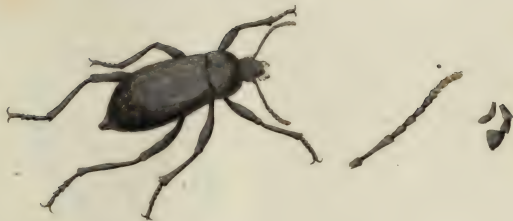
Blaps mortifera .